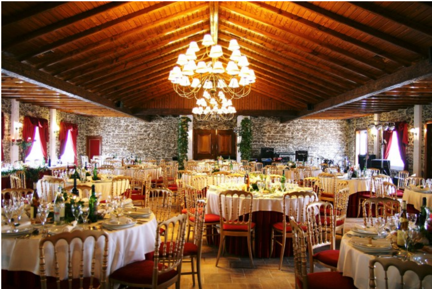
Lanche de Casamento