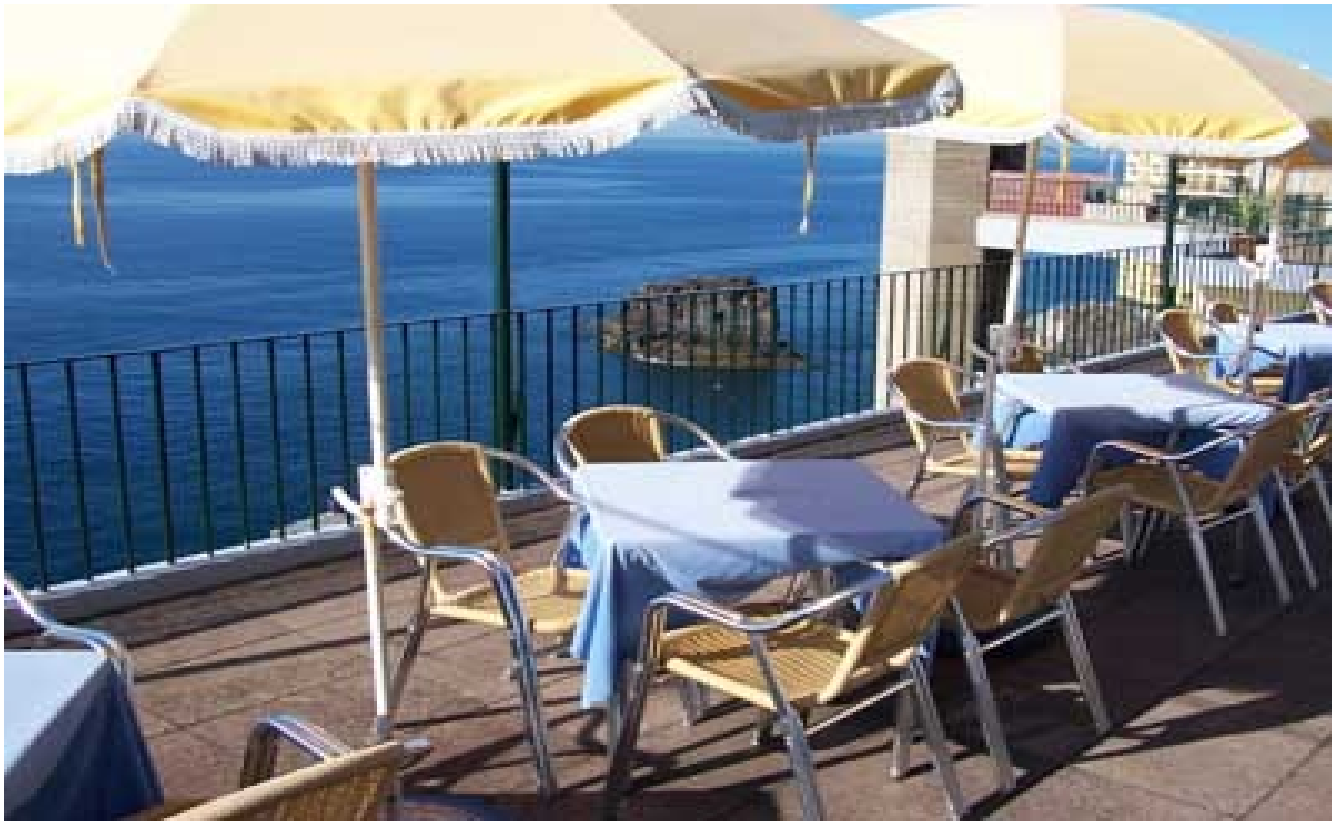
Restaurante de Turismo