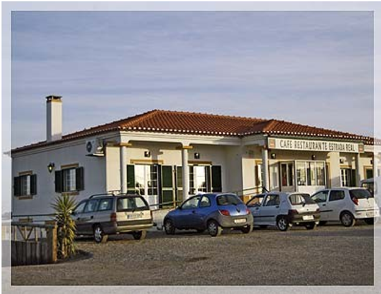
Restaurante de Estrada