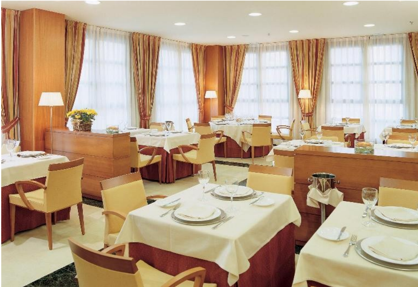
Restaurante de Hotel