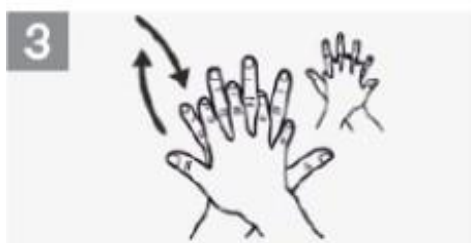
3 Palma da mão direita no dorso da esquerda, com os dedos entrelaçados e vice-versa