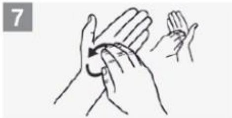
7 Esfregue rotativamente para trás e para a frente os dedos da mão direita na palma da mão esquerda e vice-versa