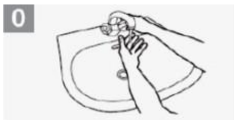
0 Molhe as mãos com água