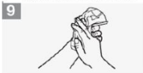
9 Seque as mãos com toalhete descartável