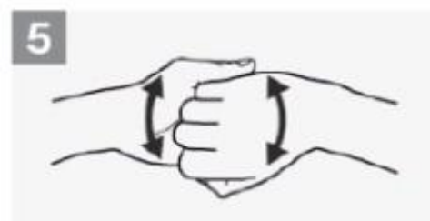
5 Parte de trás dos dedos nas palmas opostas com os dedos entrelaçados