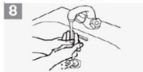
8 Enxagüe as mãos com água