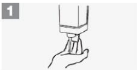
1 Aplique sabão para cobrir todas as superfícies das mãos