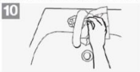
10 Utilize o toalhete para fechar a torneira, se esta for de comando manual