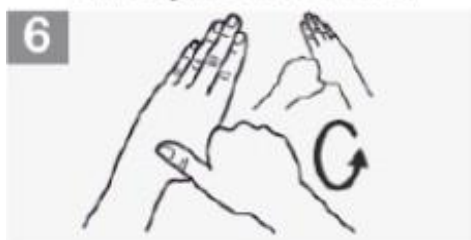
6 Esfregue o polegar esquerdo em sentido rotativo, entrelaçado na palma direita e vice-versa