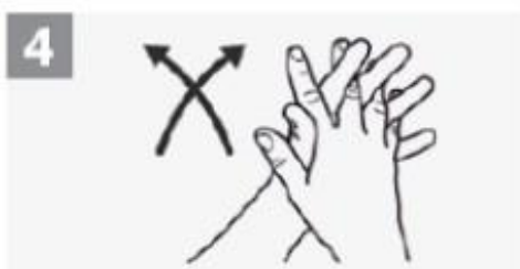
4 Palma com palma com os dedos entrelaçados